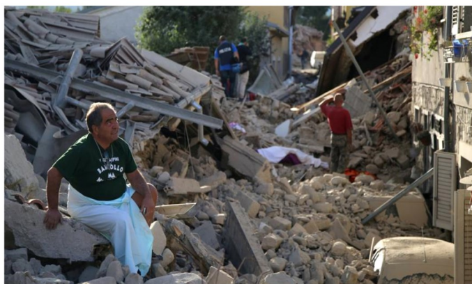
Macerie ad Accumoli, uno dei comuni devastati dal sisma.

I n alcune zone del Pianeta si verificano in modo ricorrente i terremoti: vibrazioni del terreno causate da un'improvvisa liberazione di energia con effetti spesso devastanti. Quando due placche si scontrano, le rocce che le compongono entrano in tensione, accumulando energia finché si verifica una frattura, chiamata faglia, che le porta a slittare in direzioni opposte.