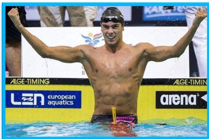
Il nuotatore olimpico Gabriele Detti.

Un giorno, degli amici che fanno Nuoto e che hanno partecipato alle nazionali del 2014 mi hanno detto: "Noi nuotatori non nuotiamo perché è divertente. Chiedi pure a chiunque fra di noi molti ti diranno che lo detestano in realtà. Ma non possiamo immaginare le nostre vite senza. È parte di noi, è ciò per cui viviamo. Viviamo per le due ore di allenamento ogni giorno, le feste con la squadra, il tifo, le trasferte in pullman, le qualificazioni, le cuffie perdute, il cloro, gli scherzi, l'amicizia, le risate, i rimproveri dell'allenatore che al momento detesti ma che poi ti renderai conto di quanto ti saranno serviti. Viviamo per quella sensazione che senti quando riesci a battere il ragazzo accanto a te per un decimo di secondo, perché noi sappiamo quanto è importante e che quelle sue vasche in più che hai fatto in allenamento ne valevano la pena. Viviamo per il tuffo al suono dello sparo in partenza, o per quella sensazione allo stomaco qualche minuto prima della gara a cui non ci si abitua mai. Viviamo per gli allenamenti in palestra e per gli obiettivi che ci prefissiamo a inizio stagione. Viviamo per la squadra che diventa la tua famiglia. Viviamo per la playlist che canticchiano nella mente durante le serie più lunghe. Viviamo per le gare, per gli amici, per la squadra e la fatica."