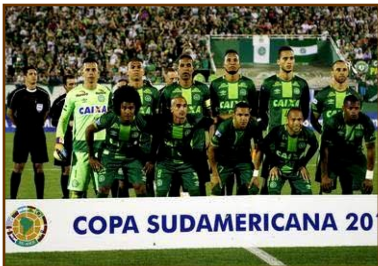
L'ex squadra brasiliana del Chapecoense.

trasportare i calciatori non è mai arrivato a destinazione ed è precipitato proprio mentre si stava avvicinando all'aeroporto José Maria Cordoba alle ore 10 locali, le 4 in Italia. A bordo dell'aereo vi erano 81 passeggeri , compresi i membri dello staff, 76 di loro purtroppo hanno perso la vita e i superstiti purtroppo solo 5 di cui 3 calciatori in condizioni gravi. La triste tragedia si presuppone che sia avvenuta per mancanza di carburante, ma per adesso la verità è ancora molto lontana, infatti, negli ultimi giorni, è emerso anche che il pilota avesse un mandato d'arresto.