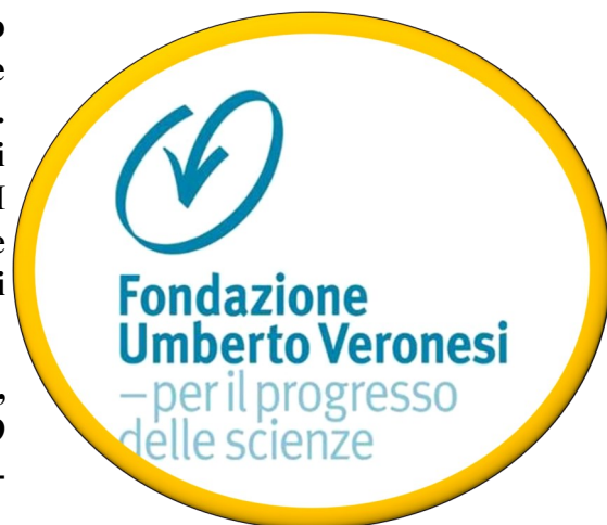
Logo della Fondazione Umberto Veronesi .

Umberto Veronesi nasce a Milano il 28 novembre 1925. Perde il padre all'età di sei anni. Data la scomparsa dell'amato, risulterà significativa la figura della madre. Infatti è evidente l'encomio fattole nel libro "Dell'amore e del dolore delle donne": "Mia madre mi ha fatto da padre, da sorella maggiore, da compagna di viaggio, perché io ho perso mio padre a 6 anni... un bambino ha bisogno di una guida e mia madre è stata la grande guida,