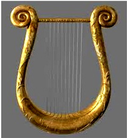
Lira: antico strumento musicale dei poeti greci.