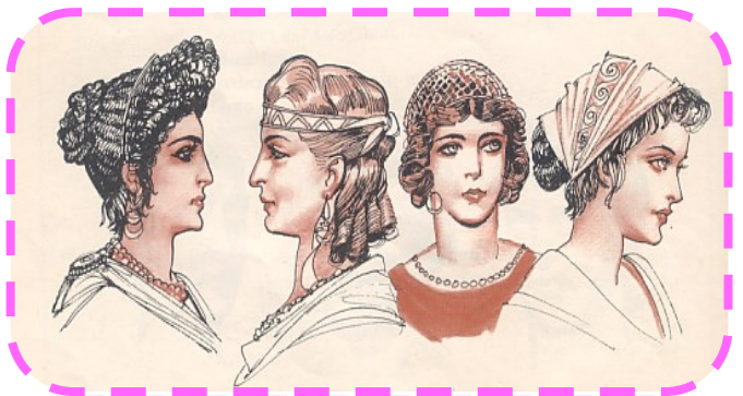
Acconciature di moda nell'antica Roma

Ma di cosa si serviva un ornatrix per la cura dei capelli della matrona? Il pettine più comunemente utilizzato era quello in osso, i cui più pregiati si trovavano a Cillene, ricavanti dal guscio delle tartarughe. Sempre in osso erano gli aghi crinali che servivano a fermare le ciocche di capelli nelle acconciature, l'avorio invece era utilizzato per i fermacapelli. Sempre all' ornatrix era affidato il taglio dei capelli e a questo punto possiamo dire che per quest'azione l'ancella correva un vero e proprio rischio nello sbagliare. Quasi sempre accadeva perché le forbici dell'antichità, al contrario di quelle di oggi erano formate da un unico pezzo con le braccia congiunte, utilizzato non solo per i capelli ma anche per aggiustare le ciglia. Il risultato come ben si può immaginare non sempre era quello previsto, poiché essendo prive di un perno centrale le forbici più che un effetto di parità davano l'effetto di una vera e propria scalatura. Esisteva una moda anche per il colore dei capelli : il biondo durante la seconda metà del I secolo ma anche il nero e il rosso. La donna si tingeva i capelli, oltre che per nascondere l'età, anche solo per gusto. Ma possiamo ben immaginare che le tinture che avevano a disposizione a quei tempi non erano poi così sicure per questo motivo, tinture sbagliate causavano perdita di capelli cosa che portò le donne ad utilizzare le parrucche .