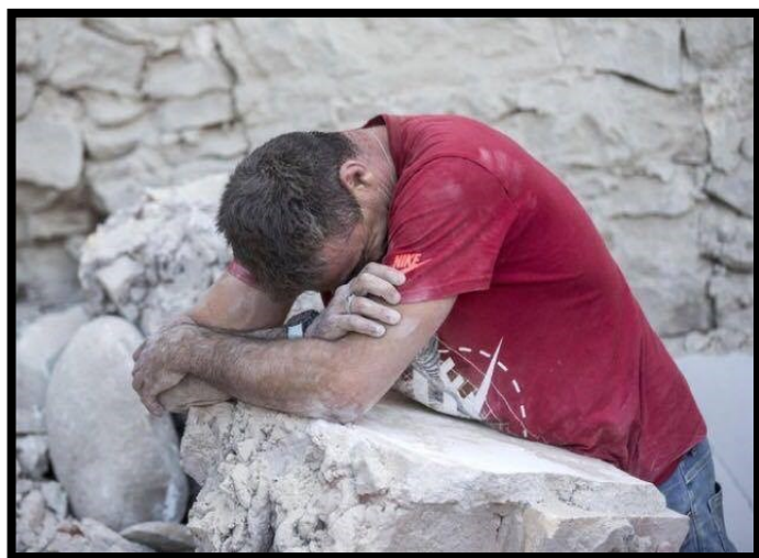
La disperazione di chi, a causa del terremoto, ha perso tutto.

Tutta l'Italia si è mossa in aiuto delle vittime. I militari hanno subito raggiunto le zone colpite dal sisma, pronti a scavare con le mani per salvare le persone incastrate tra i resti delle loro case.