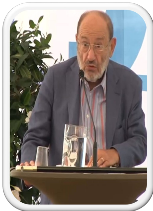
Umberto Eco mentre tiene una lectio magistralis al Festival Della Comunicazione 2014.

“I social media danno diritto di parola a legioni di imbecilli che prima parlavano solo al bar dopo un bicchiere di vino, senza danneggiare la collettività. Venivano subito messi a tacere, mentre ora hanno lo stesso diritto di parola di un Premio Nobel. È l’invasione degli imbecilli”.