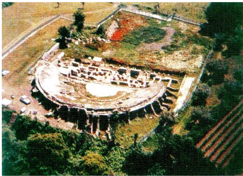
Una delle poco reperibili visuali dall'alto dell'anfiteatro di Cales.

Del periodo romano, nell'area archeologica troviamo ancora oggi alcuni importanti monumenti urbani come le terme centrali e settentrionali , l' anfiteatro , un tempio pagano (di cui però non è visibile quasi nulla) e il teatro di Cales che sorge presso il limite occidentale delle mura e a poca distanza dal foro. Oggi, gli scavi hanno permesso quasi la completa messa in luce di quest'ultimo che si estende in uno spazio quadrangolare a sud di un'area sacra. Purtroppo il teatro di Cales è stato spogliato del suo notevole apparato decorativo, infatti molti frammenti ed elementi architettonici in marmo e tufo sono stati rinvenuti nei vari strati ed oggi sono in stato di abbandono. A partire dal IV secolo, la città divenne sede vescovile e nell'XI fu costruita la Cattedrale romanica di San Casto .