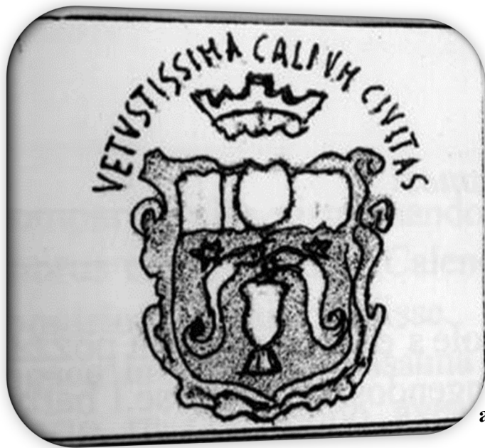
Stemma dell'antica Cales.

C ales viene considerata la più importante città dell'antico popolo italico degli Ausoni, ma fu anche sede di Etruschi, Latini e Sanniti. Si trovava sull'antica via Latina (via Casilina), vicino alle montagne sannitiche, pochi chilometri a nord di Casilinum (Capua), appena a sud di Teanum Sidicinum (Teano). Oggi il sito archeologico si trova poco distante da Calvi Risorta. In antichità, la città era nota per la produzione dei vasi caleni in ceramica a vernice nera con decorazione impressa a stampo e per la produzione di migliaia di "ex-voto", tra cui statue, rilievi fittili, testine, vasetti miniaturistici e famosa anche per la produzione del vino. Nel 335 a.C. i Romani, dopo essere giunti in Campania, conquistarono la città sotto la guida del console Marco Valerio Corvo e vi fondarono le prime colonie latine nella zona. Cadde nelle mani dei sanniti nel 298 a.C e negli anni successivi fu definita "municipium" da Cicerone e Ora-