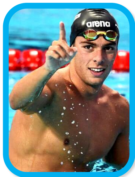
L'atleta olimpico Gregorio Paltrinieri.

La storia del nuoto trova le sue origini sin dall'antichità, oltre 7000 anni fa, come testimonia il rinvenimento di pitture rupestri rappresentanti uomini nell'atto del nuoto risalenti all'Età della pietra. Il nuoto competitivo in Europa iniziò intorno al 1800 principalmente con il dorso. La prima storica generazione italiana di campioni del nuoto moderno è rappresentata da Emilio Polli , il più carismatico e forte campione di nuoto in Italia fino al 1931. Questo sport è considerato da sempre il più completo e salutare per antonomasia. Uno sport per tutte le stagioni e per tutte le tasche. In Italia abbiamo l'eccellenza che ricopre questo ruolo, una tra queste è Federica Pellegrini , che afferma: "I sacrifici li fanno tutti gli atleti, ma il nuoto è uno degli sport più faticosi in termini di preparazione. Mesi e mesi di allenamenti per una sola gara veramente importante all'anno. Una gara che, nel mio caso, dura un minuto e cinquanta secondi."