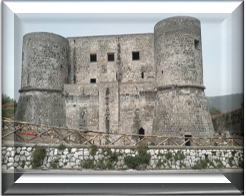
Castello angioino aragonese di Cales.

Durante il IX secolo invece fu costruito il castello angioino aragonese , che prende il nome dalla sua struttura con pianta quadrata e quattro torri cilindriche a base scarpata, innestate agli angoli. Situato alle porte settentrionali della pianura campana, il castello di Cales aveva una funzione di controllo sulla vecchia via Latina, che permetteva la maggior parte dei collegamenti tra Roma e la Campania, soprattutto perché l'Appia, risultava impraticabile presso le paludi pontine. Era circondato quasi completamente da un fossato e sicuramente era stato costruito come risposta ad esigenze strategiche e militari. Non è molto grande, ma è ordinato, essenziale e compatto. Altra caratteristica delle torri è che non sono piene alla base, con finestrelle e feritoie dietro le quali si posizionavano all'occorrenza i balestrieri e gli archibugieri. Infine, il paramento murario delle torri è composto da blocchi di piperino scuro, lisci e regolari, disposti per linee orizzontali. Al castello si accede attraverso una porta ad arco che si trova alla base della sua cortina occidentale, la quale immette in due cortili ai lati dei quali si trovano vari locali, probabilmente per gli alloggiamenti dei soldati.