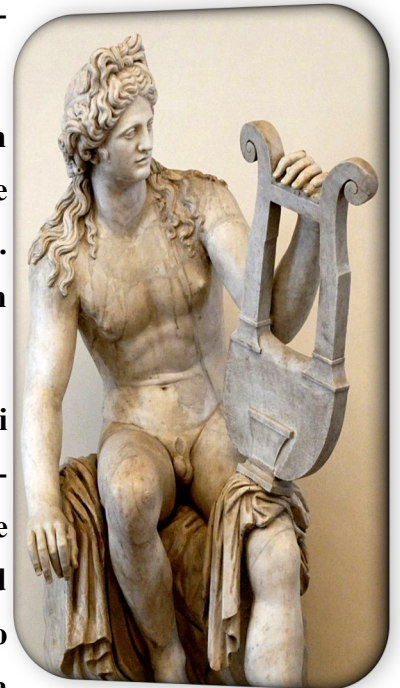
Statua raffigurante il dio Apollo, divinità protettrice di tutte le arti.

La musica, nel corso del tempo, è cambiata e si è evoluta, ma ai Greci va il merito di aver per la prima introdotto un ritmo propriamente detto. Ancora una volta, ci si può rendere conto di quanto gli antichi fossero geniali e di come tutta la nostra esistenza si basi ancora oggi sulle loro scoperte e le loro innovazioni.