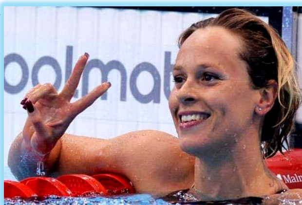
La nuotatrice olimpica Federica Pellegrini.

Ricordiamo anche altri nuotatori che hanno raggiunto livelli altissimi alle Olimpiadi di Rio ovvero Gregorio Paltrinieri ha vinto la medaglia d'oro dei 1500 stile libero e Gabriele Detti ha conquistato la medaglia di bronzo.