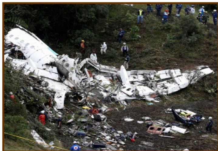
Resti dell'aereo della squadra brasiliana del Chapecoense incidentato.

A bbiamo una triste storia da raccontare, una storia dolorosa che ha commosso tutto il mondo. Questo è il racconto di una squadra brasiliana, il Chapecoense , che quest'anno ha vissuto una stagione memorabile, raggiungendo la finale della prestigiosissima Copa Sudamericana, dove avrebbe dovuto sfidare i rivali dell'Atletico Nacional. Purtroppo, questa gara non è mai stata disputata, poiché l'aereo che avrebbe dovuto