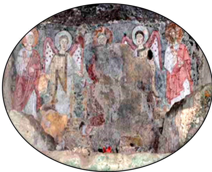
Grotta dei Santi di Cales: affresco, "Cristo in maestà tra Angeli e Santi".

Nel territorio troviamo anche delle risposte religiose post periodo romano, come ad esempio la " Grotta dei Santi " che è una delle tante tombe anacoretiche (abitazioni di religiosi che abbandonano la società per vivere da solitari), presenti a Cales e databile intorno al X secolo; in questa scavata profondamente nel tufo, troviamo un complesso ciclo di affreschi , tra cui: il " Cristo in maestà tra Angeli e Santi "; sulla parete laterale, si la "Crocifissione" e "il Martirio di S. Lorenzo". Le immagini dei Santi Cosma, Barbara, Simeone e Giovanni Battista, oggi, sono conservate invece nel Museo del Territorio della Reggia di Caserta, recuperate all'estero dopo essere state trafugate da tombaroli.